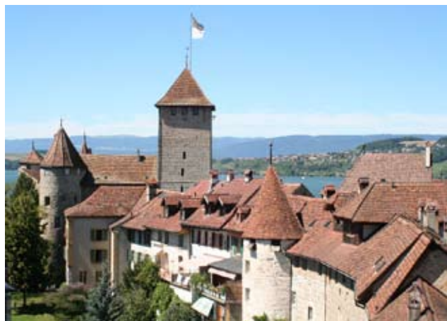
The medieval city of Murten, which is part of the historical defence line consisting of a range of several strategically situated towns like Fribourg and Thun, welcomed warmly the Assembly.

The Bishop of Christ-katholischen Kirche der Schweiz , Fritz-René Müller from Bern said that he treasures the co-responsibility, creativity and competence of the women in the church. "I have also great joy in announcing that