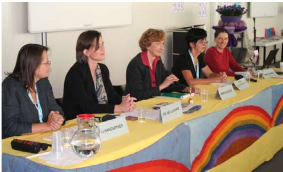
Do women of Europe need a female Charlemagne, who would bring Europe together in terms of justice and integrity of creation? This and much more was discussed at round table talks on the theme "Citizens of Europe – where are the frontiers of democracy".