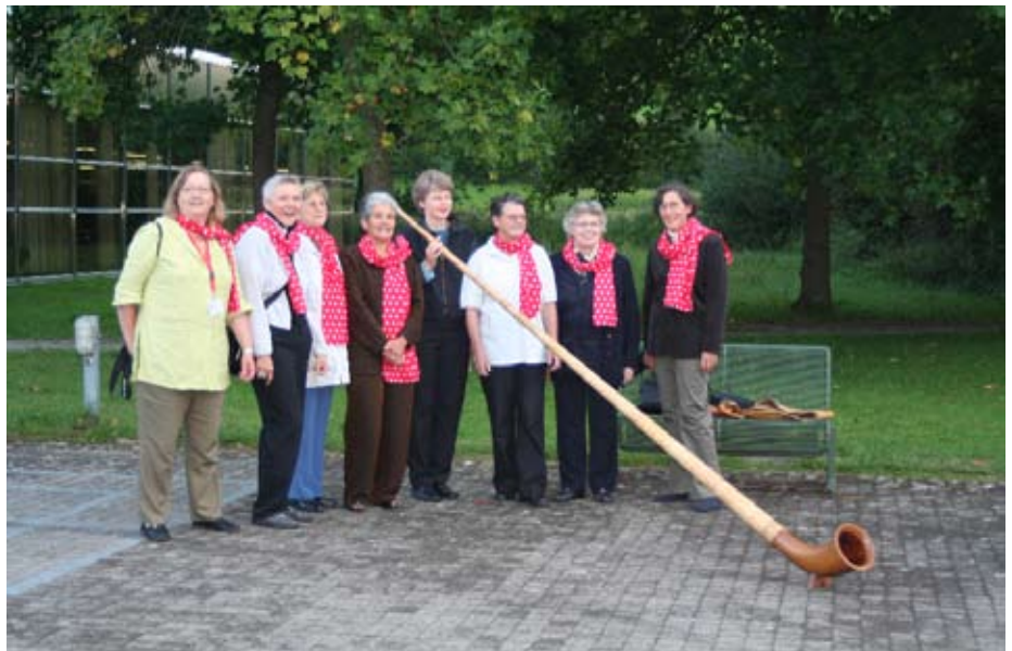
We are grateful to the women of the Swiss Forum for their outstanding hospitality and their many contributions to the VII General Assembly of the EFECW and congratulate them on the 20 th anniversary of their organization.