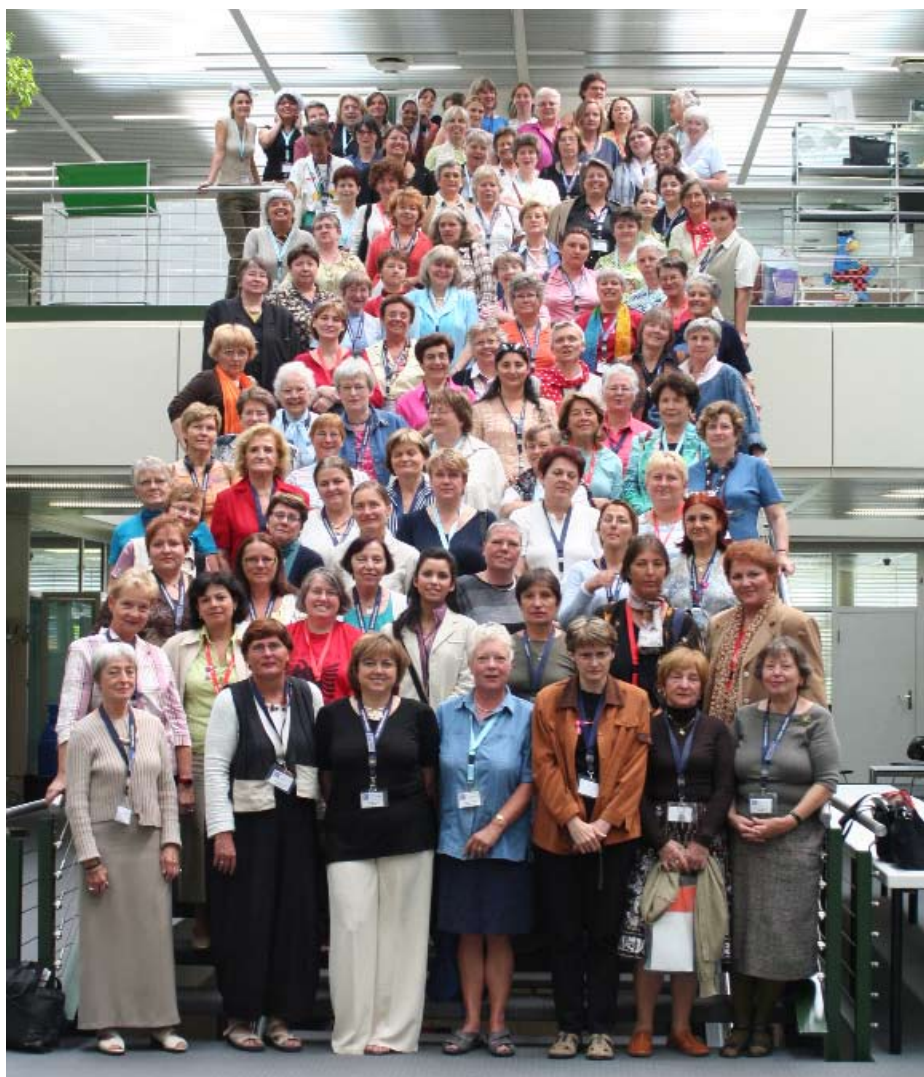
More than 150 Christian women from 27 countries in Europe, from different national, ethnic, cultural and confessional backgrounds, met at Murten, Switzerland for the VII General Assembly of the EFECW August 21–27, 2006.