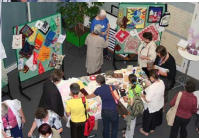
The Märit (Market) was held in the benefit of Ruth Epting Fund.