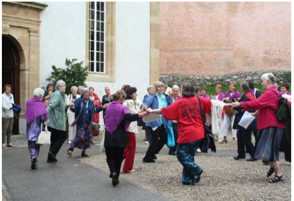
„You shall go out in joy“ was really put into practice when the participants came from the closing ceremony in the German Church of Murten.