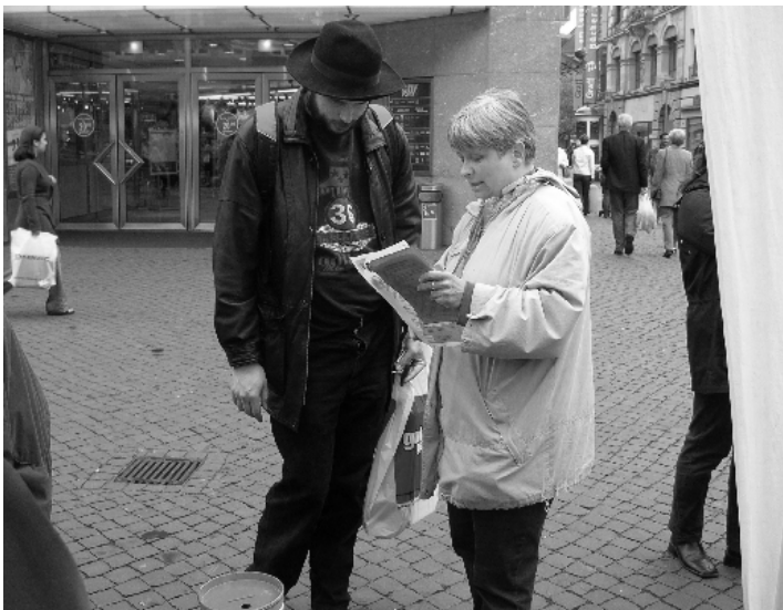
The German Forum took part in the network campagne: „Time out - stop the forced prostitution“. The campagne was succesful: the issue was discussed openly; they got political backup from the President of the state Köhler and collected 4500 € to the campagne to help Moldavian women.