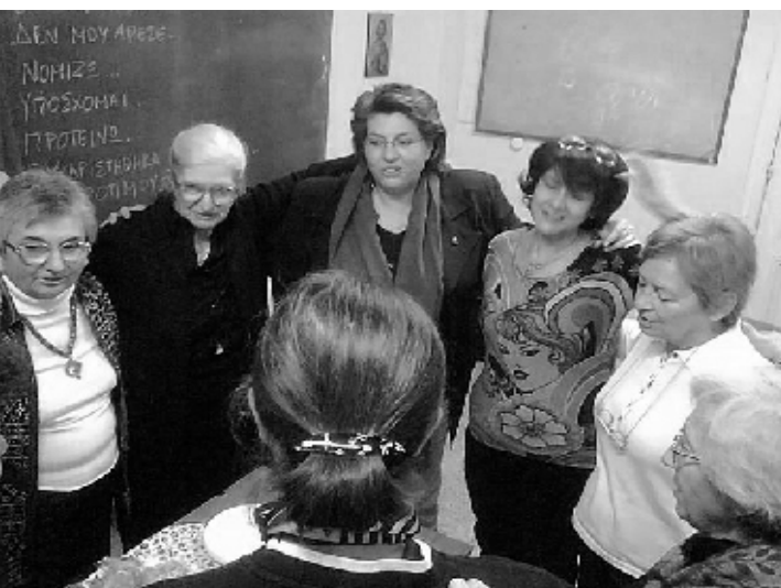
Ecumenical Leadership Training Project for Greek Women in 27.11.-12.12.2006 gathered 20 participants to Athens to further develop their skills.

From women’s point of view, the encounter was a male dominated meeting, in spite of the CEC board recommendation. Gender ba-