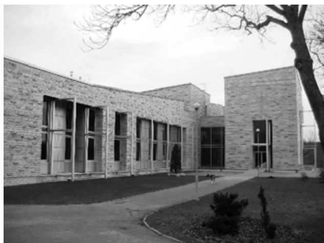
The Pirita Convent offered us warm hospitality. We are also very grateful to the Estonian Methodist Church; the Orthodox centre; and to our interpreters from Salvation Army, who did great voluntary work through long days.